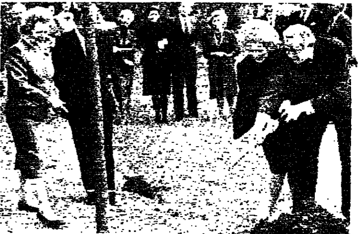
قبل مغادرتها بريطانيا حيث عمل سفيرا للولايات المتحدة طيلة ٦ سنوات، قام تشالنر برايس وزوجته كارول بقرس شجرة في حديقة منزل مارغريت تاشر رئيسة وزراء بريطانيا، التي نشاهدها وهي ترشد برايس وزوجته إلى كيفية طمر أصل الشجرة المخرّوسة. لندن - ر